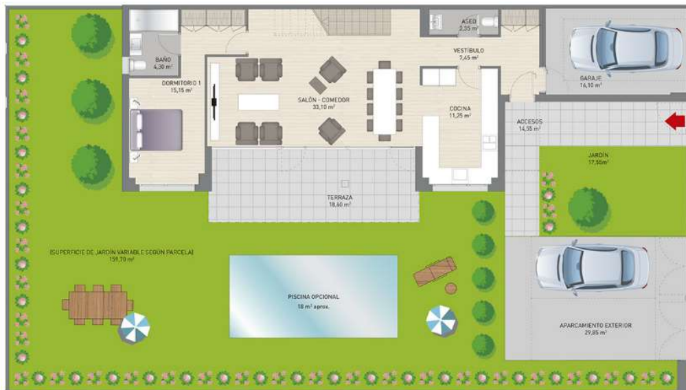
Planta baja con garaje