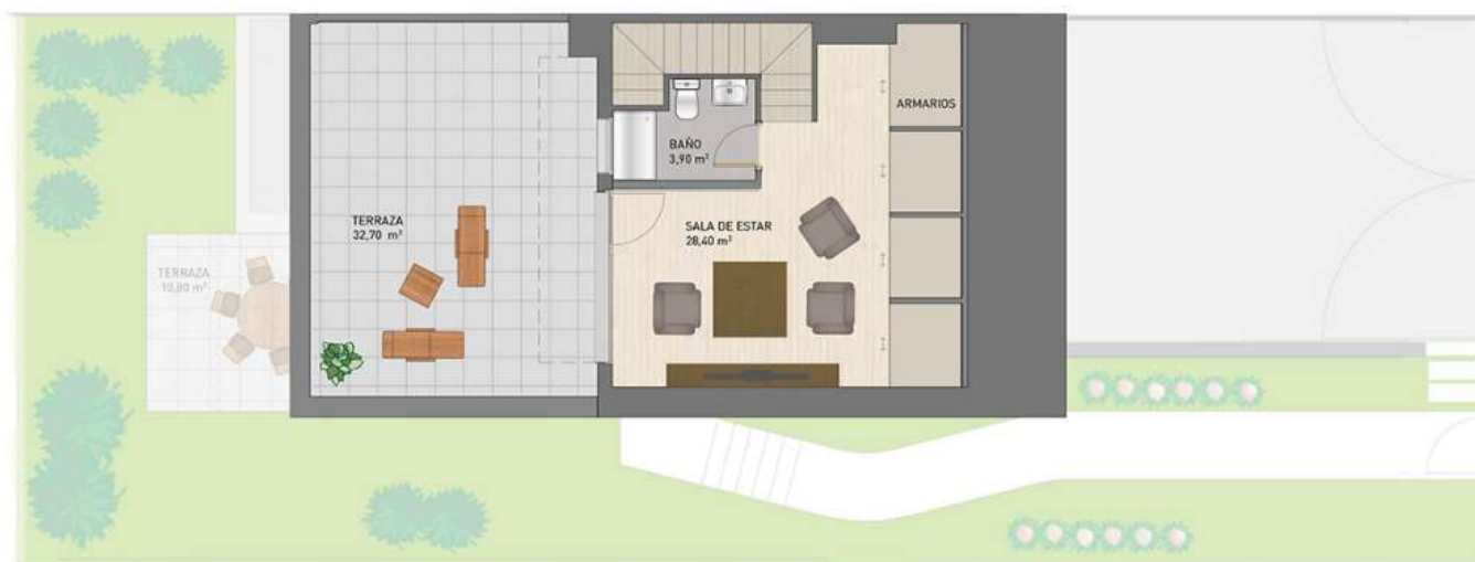
Sala de estar con baño y armarios (consulta coste)

Consulta otras distribuciones disponibles.