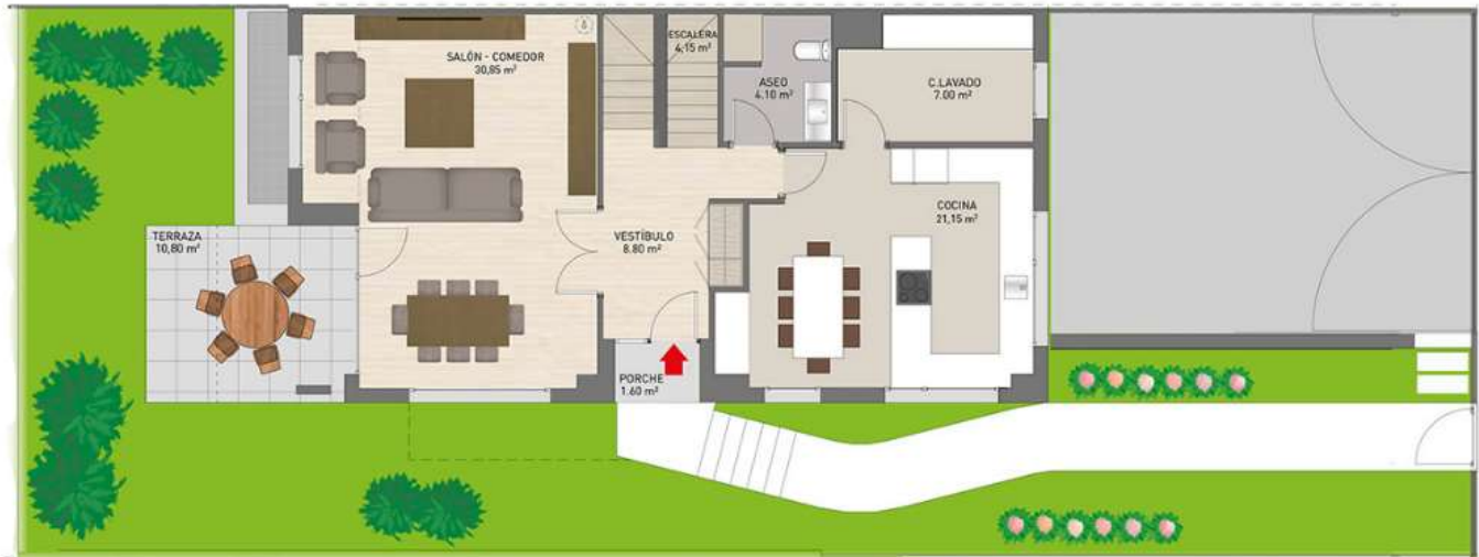
Gran cocina y cuarto de lavado