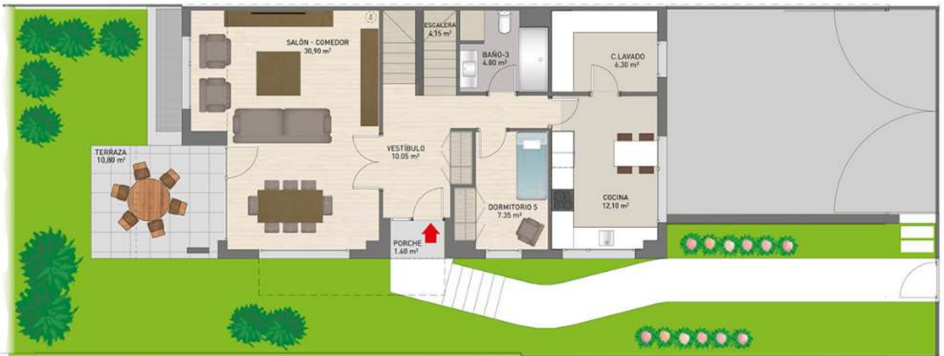
Cocina con cuarto de lavado y dormitorio de servicio

Consulta otras distribuciones disponibles.