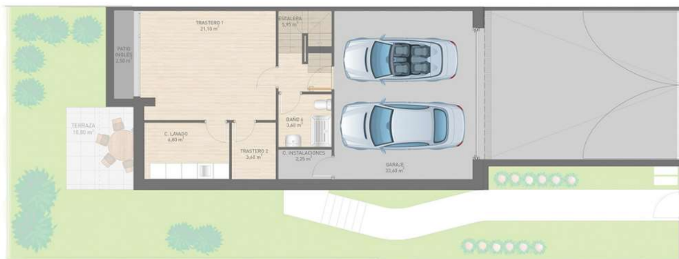
Garaje, dos trasteros, cuarto de instalaciones, baño y cuarto de lavado (consulta coste)

Consulta otras distribuciones disponibles.