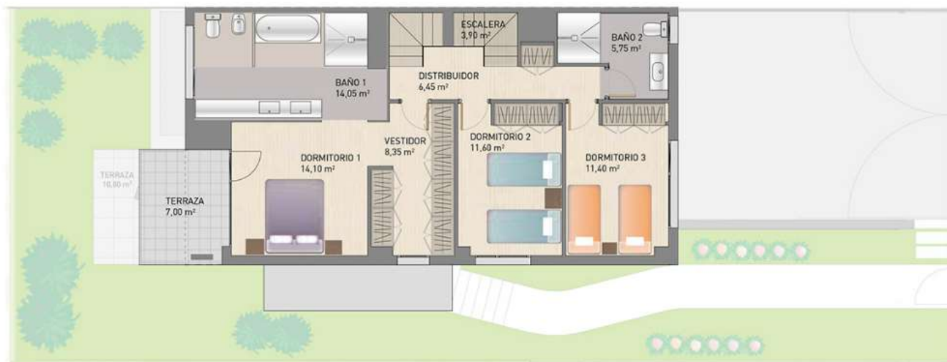
3 dormitorios con súper suite [consulta coste]